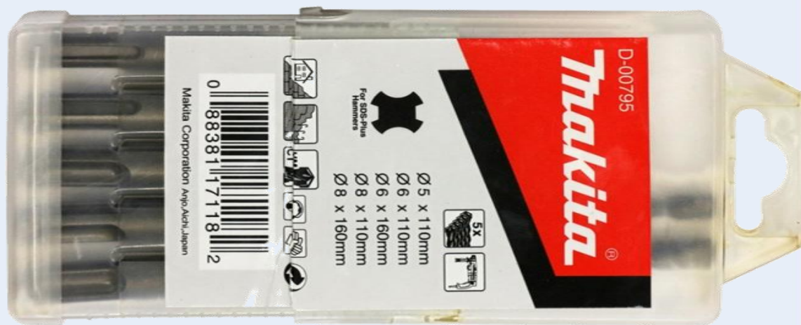
Набор буров из комплектации X5