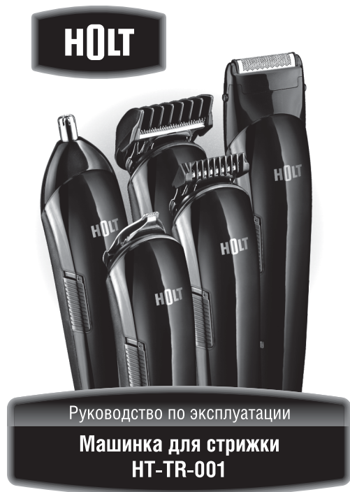
Руководство по эксплуатации Машинка для стрижки HT-TR-001