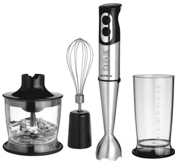
PHB 0510A Блендер электрический Hand blender

Руководство по эксплуатации / Гарантия Manual instruction / Guarantee