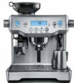
КОФЕЙНАЯ СТАНЦИЯ С805